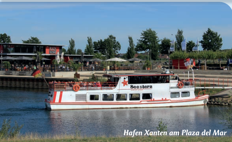
Hafen Xanten am Plaza del Mar