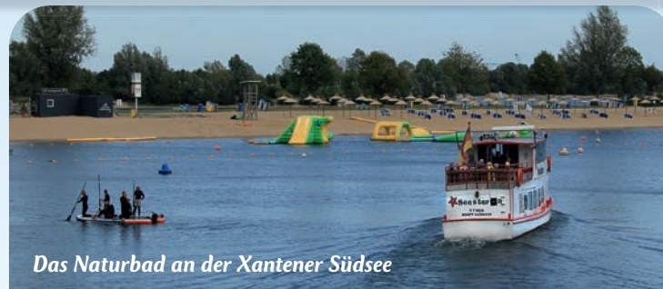
Das Naturbad an der Xantener Südsee